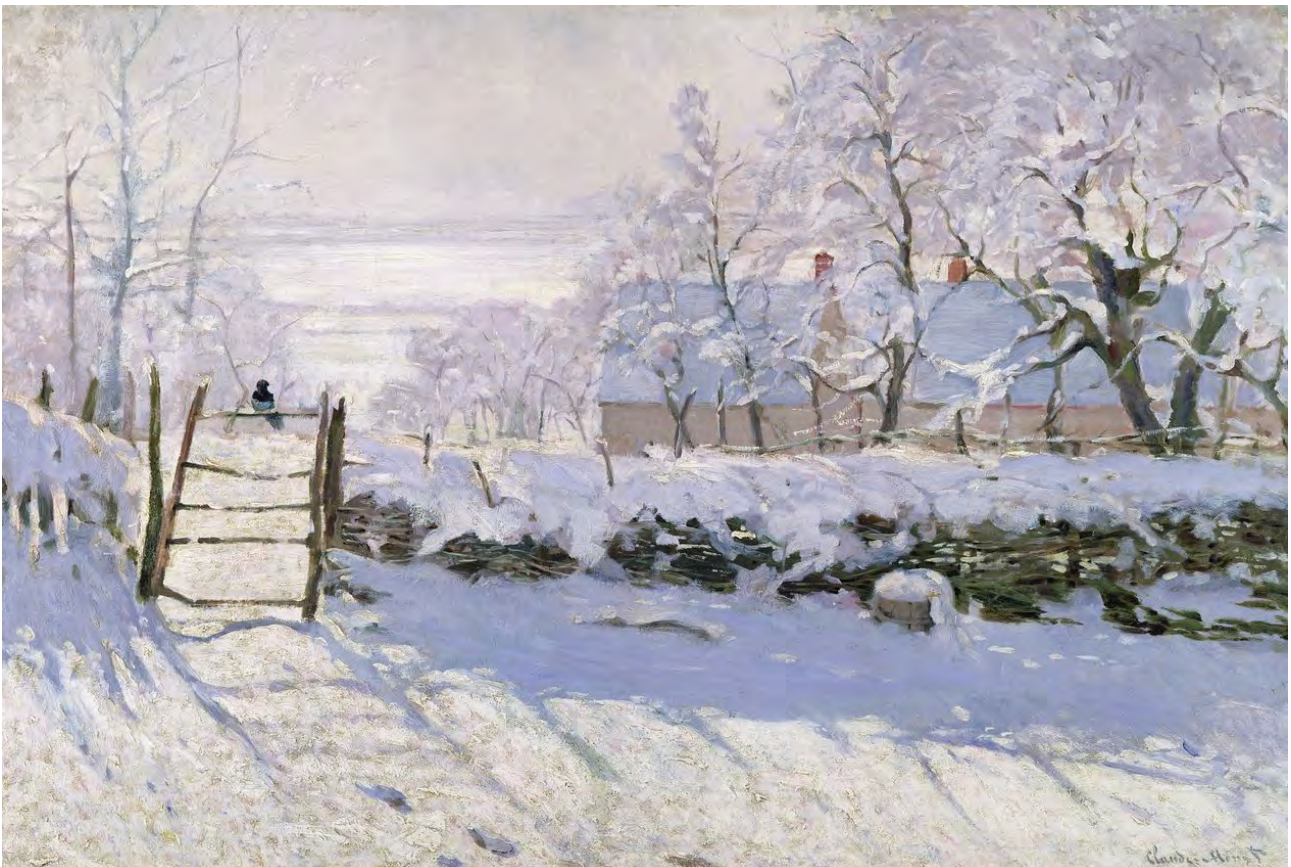
La Pie , Claude Monet 1868 – Paris, Musée d'Orsay