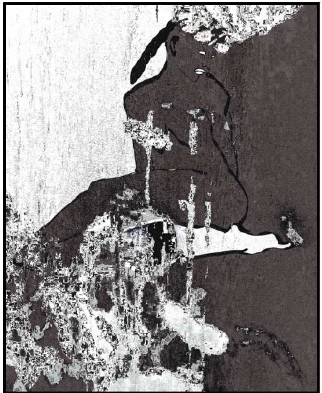
« Solitude fragmentée » @Ndoho Ange