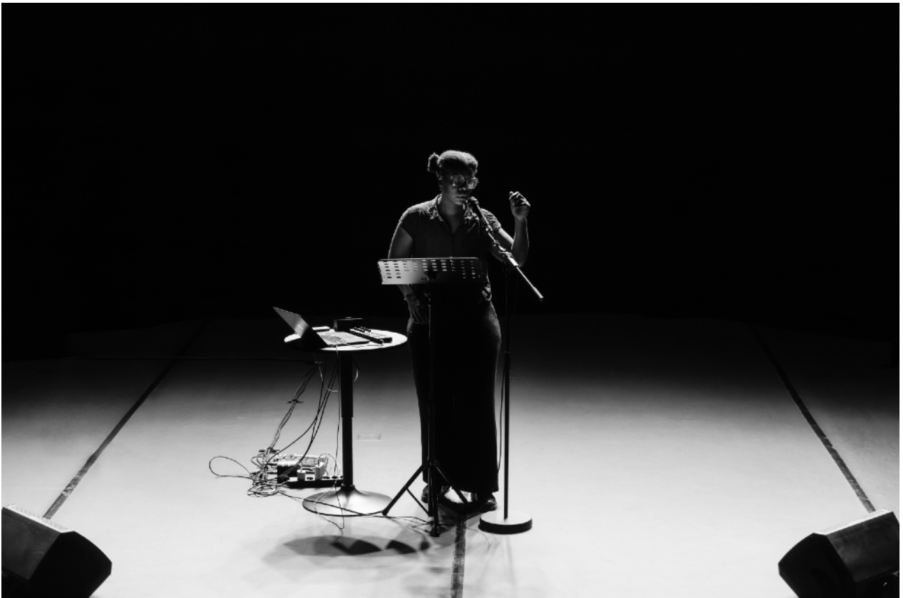
Photo de répétition au Centres des Arts du Récits - Grenoble 2026

« La forme n'a jamais été que le prolongement du contenu. » Donal Hall , poète et critique littéraire, à propos du Spoken Word