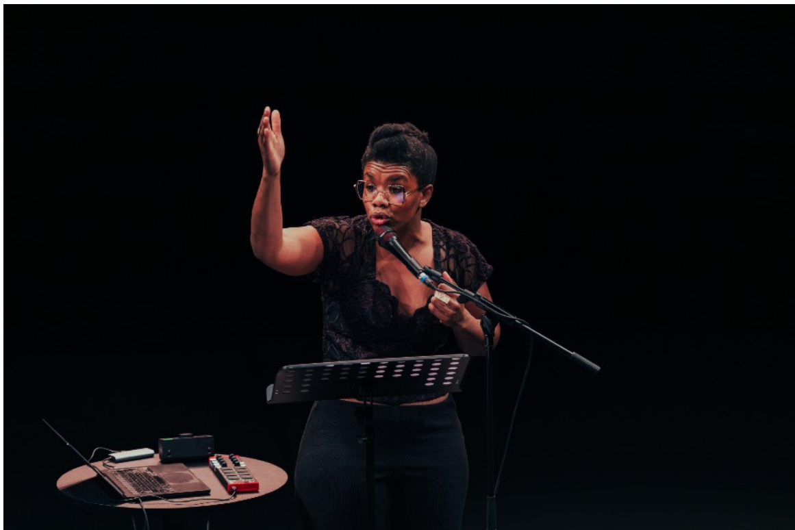
Photo sortie de résidence au Centres des Arts du Récits - Grenoble 2026