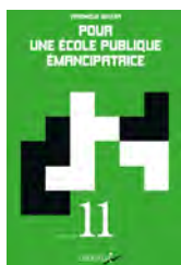
Pour une école publique émancipatrice, Véronique Decker, éd.Libertalia, 2019