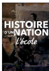
Histoire d'une nation: l'école film documentaire de Stéphane Correa, 2022