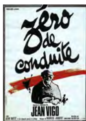
Zéro de conduite film de Jean Vigo, 1933