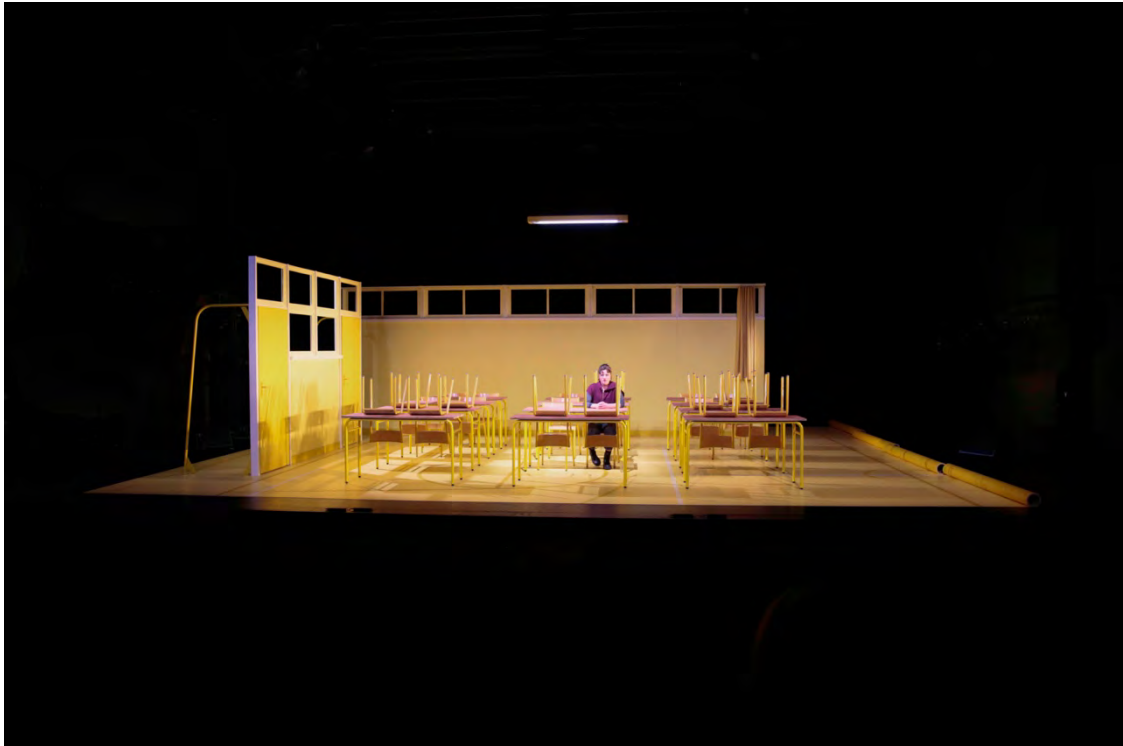
Scénographie, Thibaut Fack – @Anne Gayan