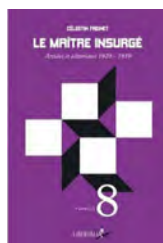
Le maître insurgé articles et éditoriaux 1920-1939, Célestin Freinet, éd.Libertalia, 2016