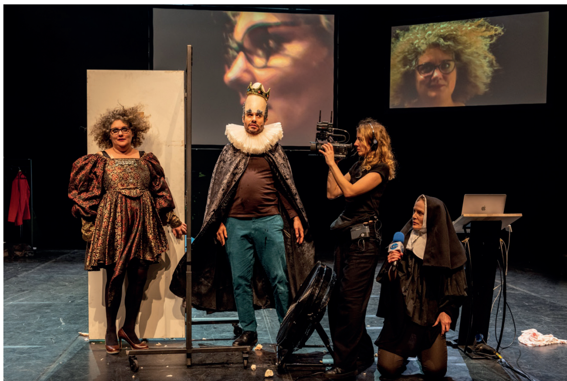
Louis XIII et Anne d'Autriche lors de la célèbre nuit d'orage qui modifia le destin de la France Borderline(s) Investigation #2 au Théâtre Nouvelle Génération Centre Dramatique National de Lyon, 2022