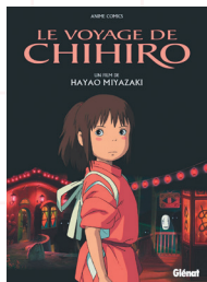
Le voyage de Chihiro, Hayao Miyazaki, Glénat (2018)

Retrouvez à la librairie du théâtre les ouvrages de Yann Verburgh et une sélection de livres en lien avec les thématiques du spectacle, par exemple :