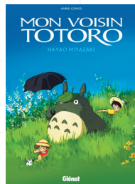
Mon voisin Totoro, Hayao Miyazaki, Glénat (2018)