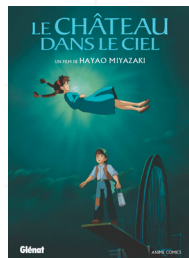
Le château dans le ciel, Hayao Miyazaki, Glénat (2021)